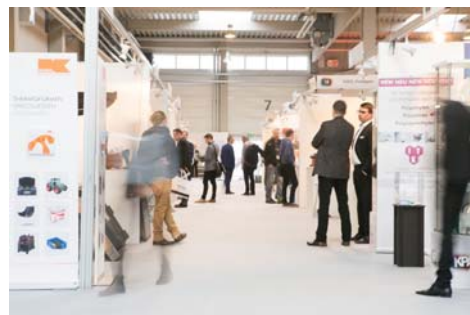
Eindrücke von der KPA 2019