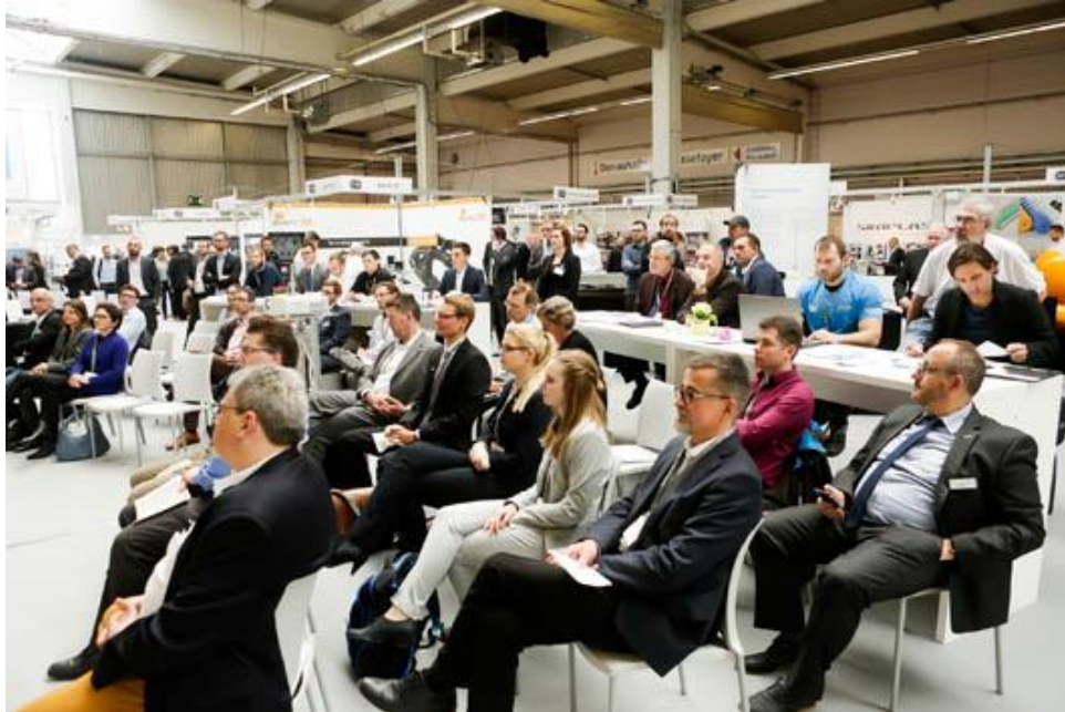
Bild Nr. 54-03 EF_KPA-Zuhoerer.jpg.

Wertvoller Austausch: Die Fachmesse KPA – Kunststoff Produkte Aktuell ist auch wegen ihrer Vorträge ein Publikumsmagnet in der Kunststoffbranche.